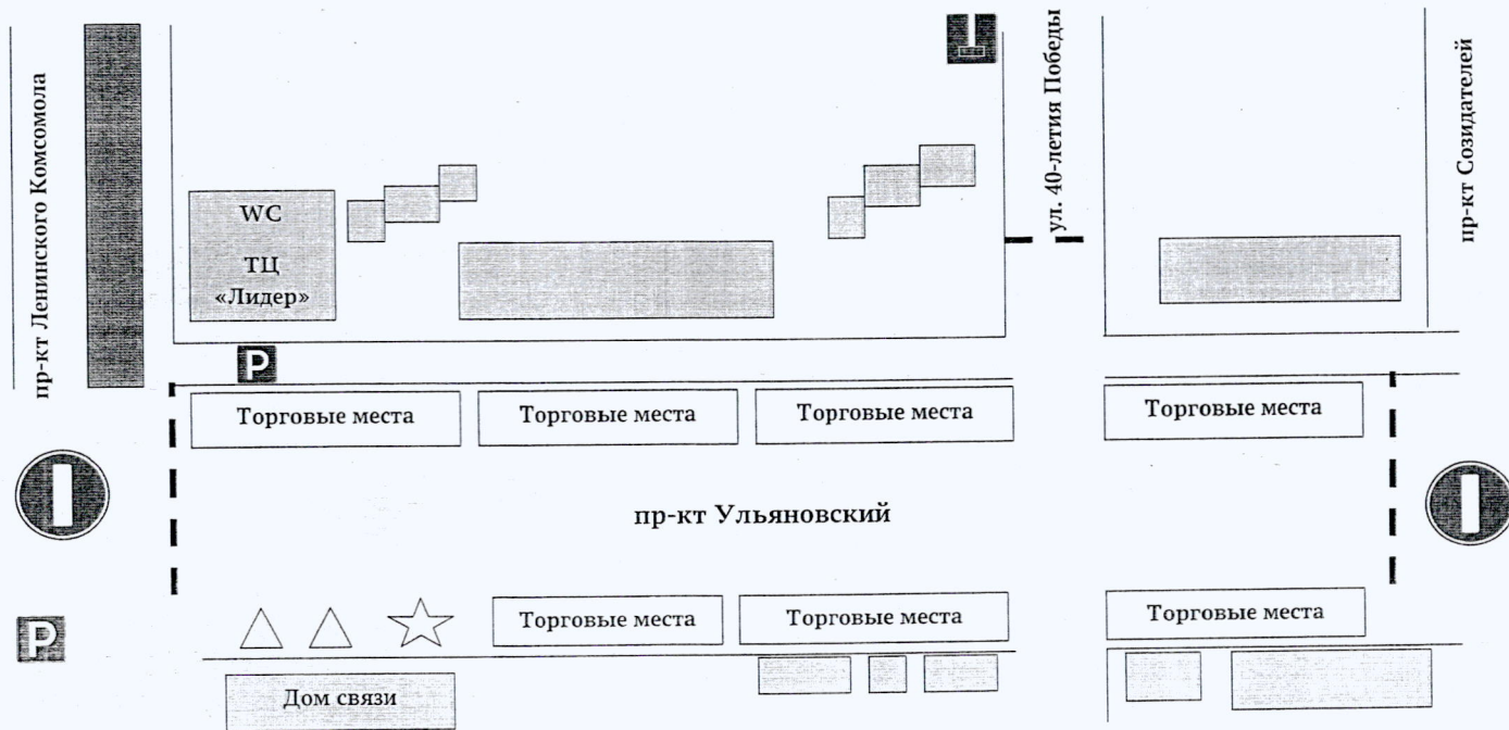
СХЕМА размещения торговых мест на ярмарке в Засвияжском районе