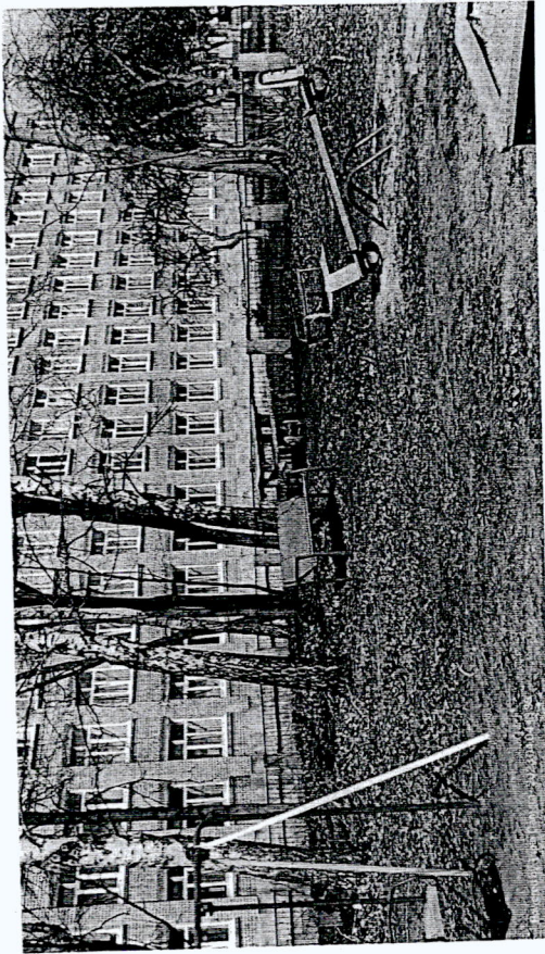
Демонтируемый объект: стол с лавками

Местоположение демонтируемого объекта: г. Ульяновск, ул. Радищева, вблизи дома № 166 (условно - № 2)