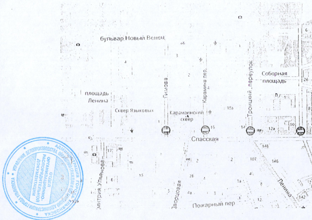
Схема организации дорожного движения в Ленинском районе города Ульяновска 04.06.2023 с 04.00 часов до 15.00 часов