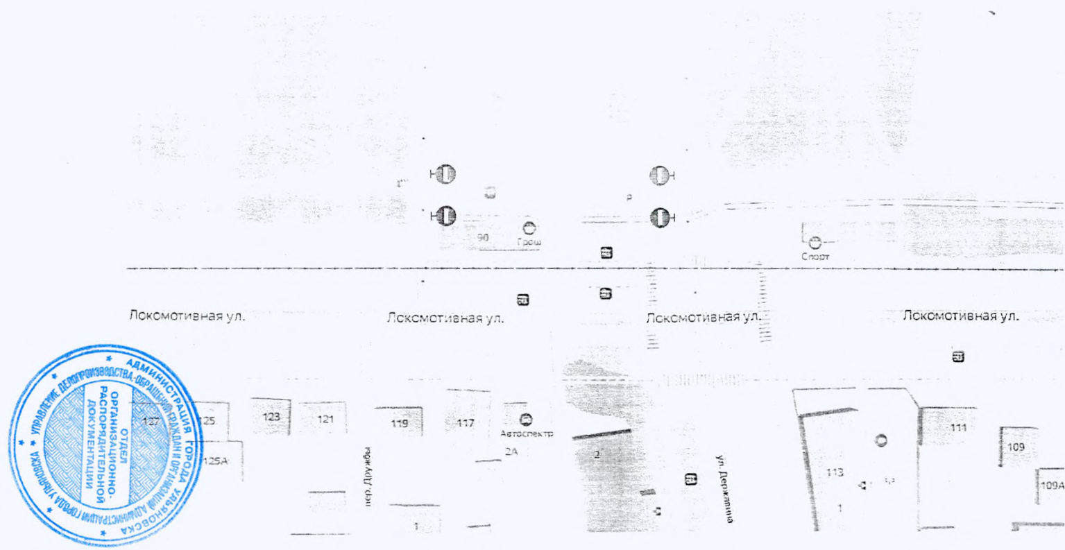
СХЕМА организации дорожного движения в Железнодорожном районе города Ульяновска 06.05.2023 с 12.30 до 16.30 часов